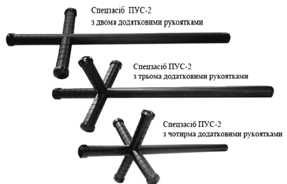
Фото 1. Сучасні види тонфи

Гумовий кийок є прямою палицею, котра виготовлена зі спеціальної пружної (еластичної) гуми. Залежно від моделі кийків їх конструкція, матеріал, вага, довжина і товщина можуть бути різними. Раніше поліцейські кийки виготовляли з міцних порід дерева . Зараз їх найчастіше виготовляють із гуми і полімерного синтетичного матеріалу , рідше з пластику та з металу . Наприклад, палиці ПГ-М, ПГ-С, ПГШ виготовлені методом лиття з пружної гуми, мають зручну